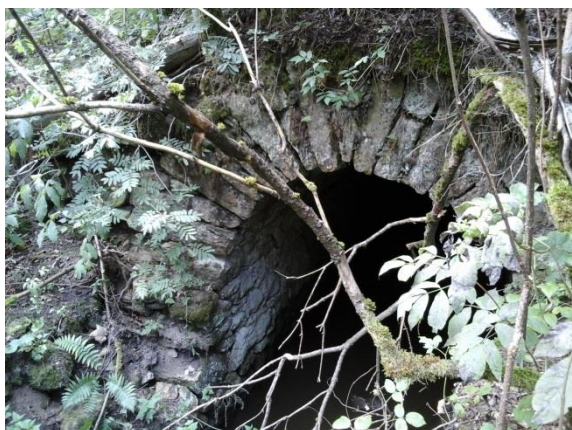
Obr. 5 Vtok do štol (návodní svah hráze)