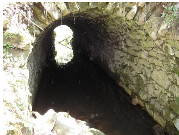
Obr. 4 Štola pod lesní cestou