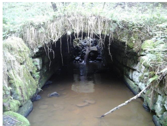
Obr. 2 Zachovaná spodní část štol