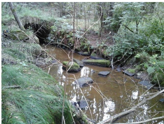
Obr. 1 Romavský potok pod štolou