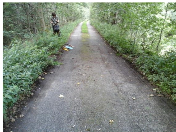
Obr. 6 LC Romavská v místě opravy